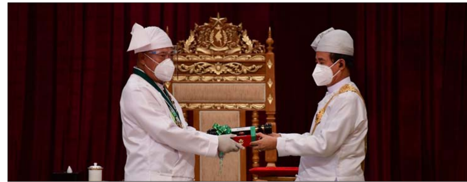
Thingaha, Order of the Republic of the Union of Myanmar) သည် နိုင်ငံတော်နှင့် ပြည်သူအတွက် စွမ်းစွမ်းတံဆောင်ရွက်ချက် ရှိသော အရပ်ဘက်နှင့် တပ်ဘက်ဆိုင်ရာပုဂ္ဂိုလ်ကိုသာ ရွေးချယ်ချီးမြှင့်သည့် “ပြည်ထောင်စုစည်သူသင်္ဂဟဂုဏ်ထူးဆောင်ဘွဲ့” ဖြစ်ပါသည်။ မြန်မာနိုင်ငံလူငယ်စွန့်ဦးတီထွင်လုပ်ငန်းရှင်များအသင်း (MYEA)